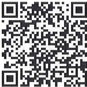
防制學生藥物濫用 資源網